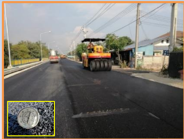
ดำเนินการลาดผิวจราจรแอสฟัลต์คอนกรีต