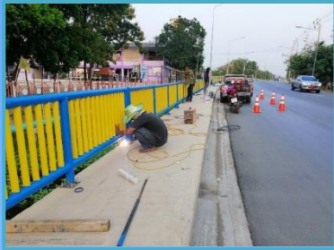
ดำเนินการติดตั้งราวกันตก