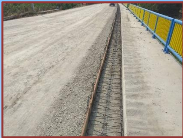
ดำเนินการเทคอนกรีตรางระบายน้ำรางพื้น